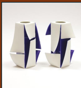
北原 睦史 Kitahara, Atsushi

Venez découvrir comment les peintures anciennes et les kimonos japonais ont été abstraits de manière moderne