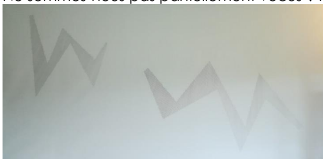
Dessin de stylo ombragé sur papier avec gradient.