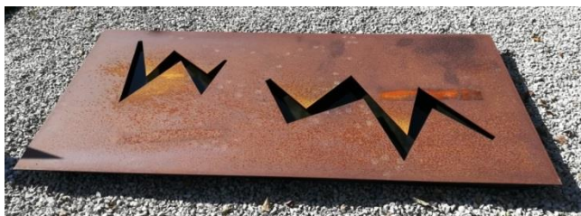
Bas Koch, 2017

Dans la plaque d'acier, un motif japonais encore plus abstrait pour le symbole de l'eau est épargné.