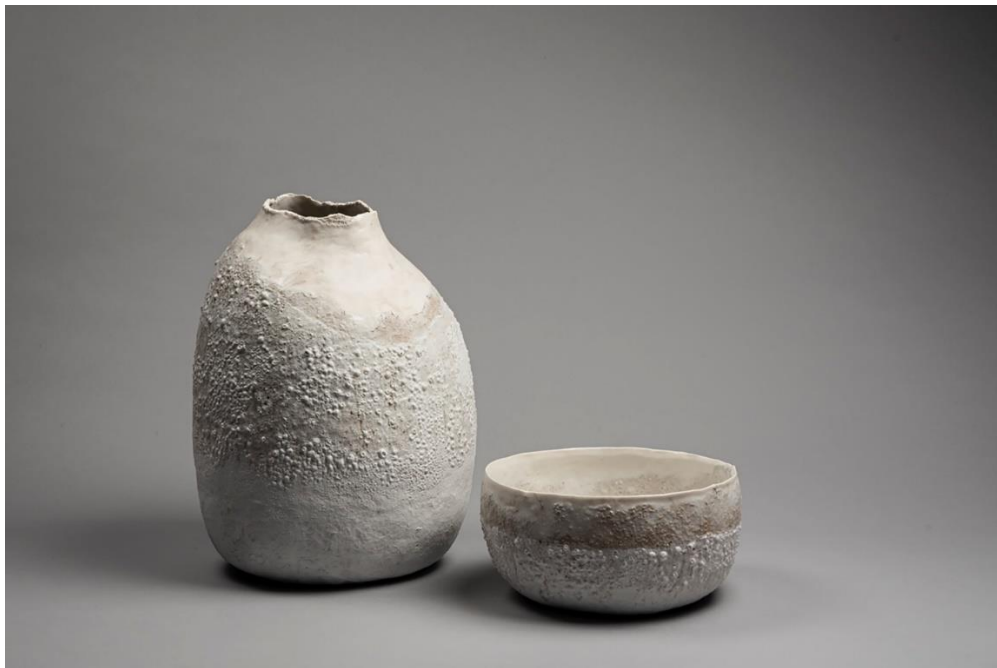
Flore Loireau , Titre: Dérobée,

Les sculptures de Flore Loireau se promènent à la lisière de l'abstraction et de la référence à la nature. L'émail est à base de frêne, émail qui rappelle les métaux naturels patinés par le temps.